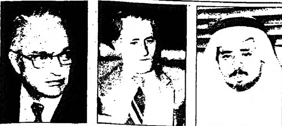
د. مصطفى خليل

عبدالله العريفيج - الرياض - محمد قواس - محمد عداوي - جدة - عكاظ - القاهرة - وكالات الأنباء - عواصم: اجمعت ردود الفعل المتواصلة على جريمة اغتيال مفتي لبنان سملحة الشيخ حسن خالد على استنكار هذه الجريمة النكراء والتعبير عن حزن المسلمين على خسارة واحد من ابرز علماء الأمة الإسلامية.. وبرزت ردود الفعل التي رصدتها «عكاظ» من خلال استطلاعات مكاتبها المحلية والخارجية على ضرورة الوفاق بين اللبنانيين لاتخاذ لبنان وقف نزيف الدم الذي يروح ضحيا له العديد من الابرياء.